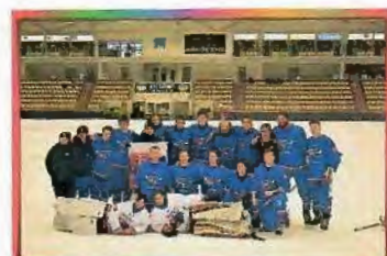
MS Švédsko 2019 Vänersborg 8.miesto