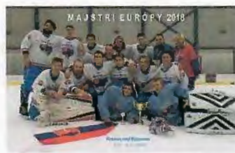
ME 2018 Krásno nad Kysucou 1. miesto