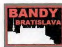
ŠK Bandy hokej Bratislava