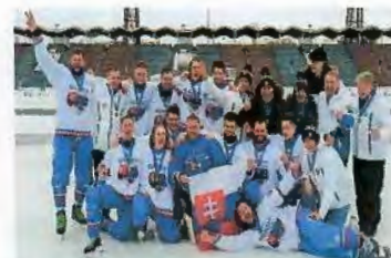
MS Rusko/Irkutsk/ 2020 3. miesto