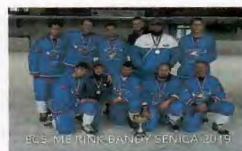
ME 2019 Senica 2. miesto