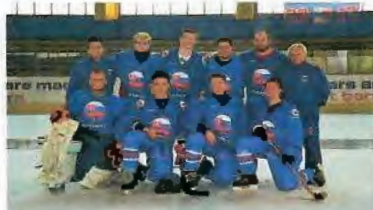
ME Nymburk 2017 2. miesto