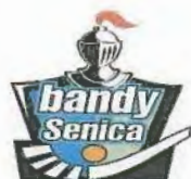
ŠK Rytiéri Bandy Senica