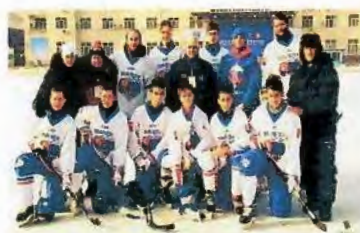
MS Čína/HARBIN/ 2018 7 miesto